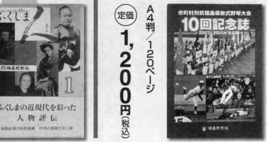
市町村対抗福島県軟式野球大会 10回記念誌 2007-2016 福島県出版

思いにあふれた1冊。 92編を収録 市町村対抗福島県軟式野球大会 10回記念誌 第1回から第10回大会までの 全成績、市町村別成績を 網羅! 長打記録、選手の活躍を捉えた写真など も掲載。