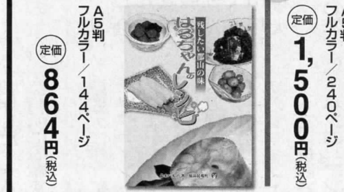
はるちゃんじっぴ A5判 フルカラー/144ページ 864円税込